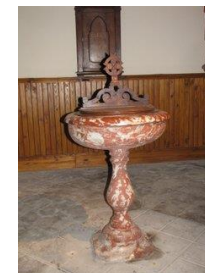
Le Baptistère en marbre rose

Tout autour de la nef vous pourrez suivre un magnifique chemin de croix en métal argenté encadré de bois verni.