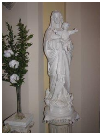
Vierge blanche à l'enfant

À droite de la nef également le monument aux morts en marbre blanc.