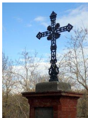
Croix de l'ancienne église Saint Prim