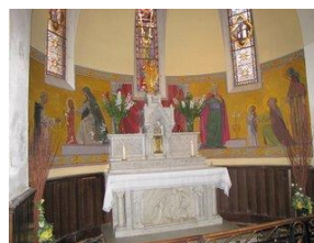
Chapelle dédiée au Rosaire

Il y a 3 chapelles autour du chœur : à gauche la chapelle St Joseph, à droite la chapelle du Sacré-Cœur et au fond la chapelle du Rosaire (les vitraux représentent les apparitions de Lourdes et de notre Dame de la Salette).