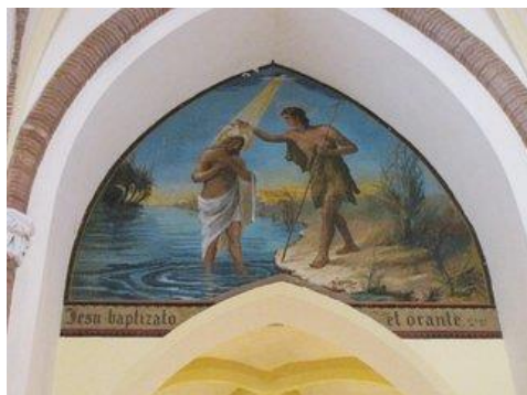
Baptême du Christ

À droite et au fond de la nef vous pourrez admirer un tableau de la mise au tombeau.