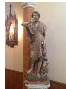
Saint Jean-Baptiste Patron de l'église

Le chœur actuel constituait l'ancienne nef. La chapelle St Joseph était l'entrée de la seconde église. La chapelle du Rosaire est le vestige de la première église (St Prim).