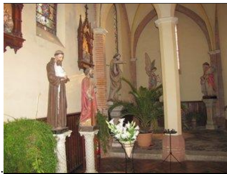
Statuaire dans le fond de l'église

À droite de la nef également le monument aux morts en marbre blanc.